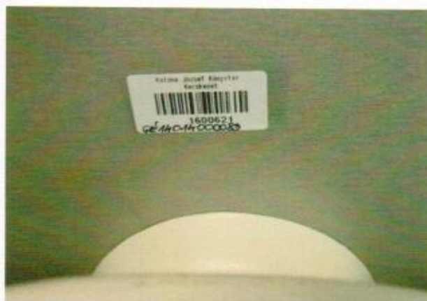
9. ábra leltári szám