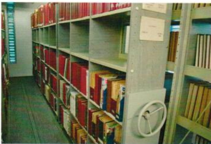
3. ábra polcszerelés után