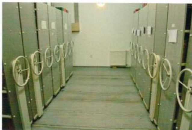
6. ábra tömőraktár