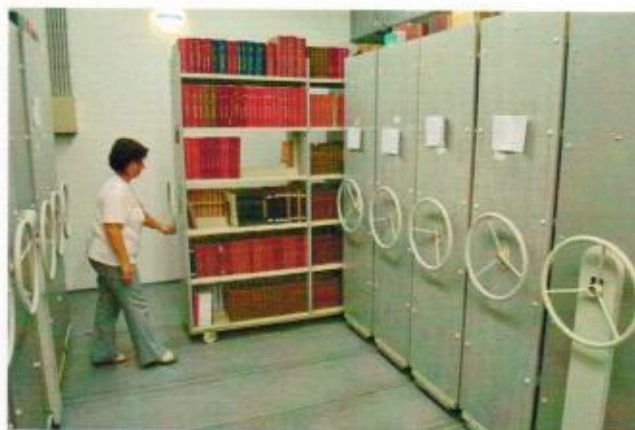
7. ábra tömőraktár használata