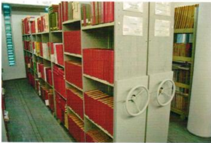
1. ábra polcszerelés előtt