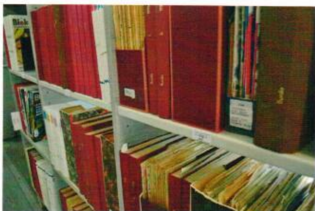
8. ábra leltári szám