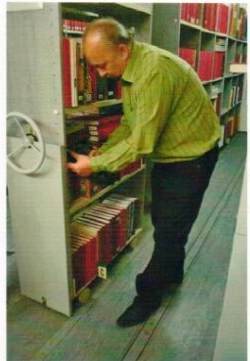
2. ábra polcszerelés