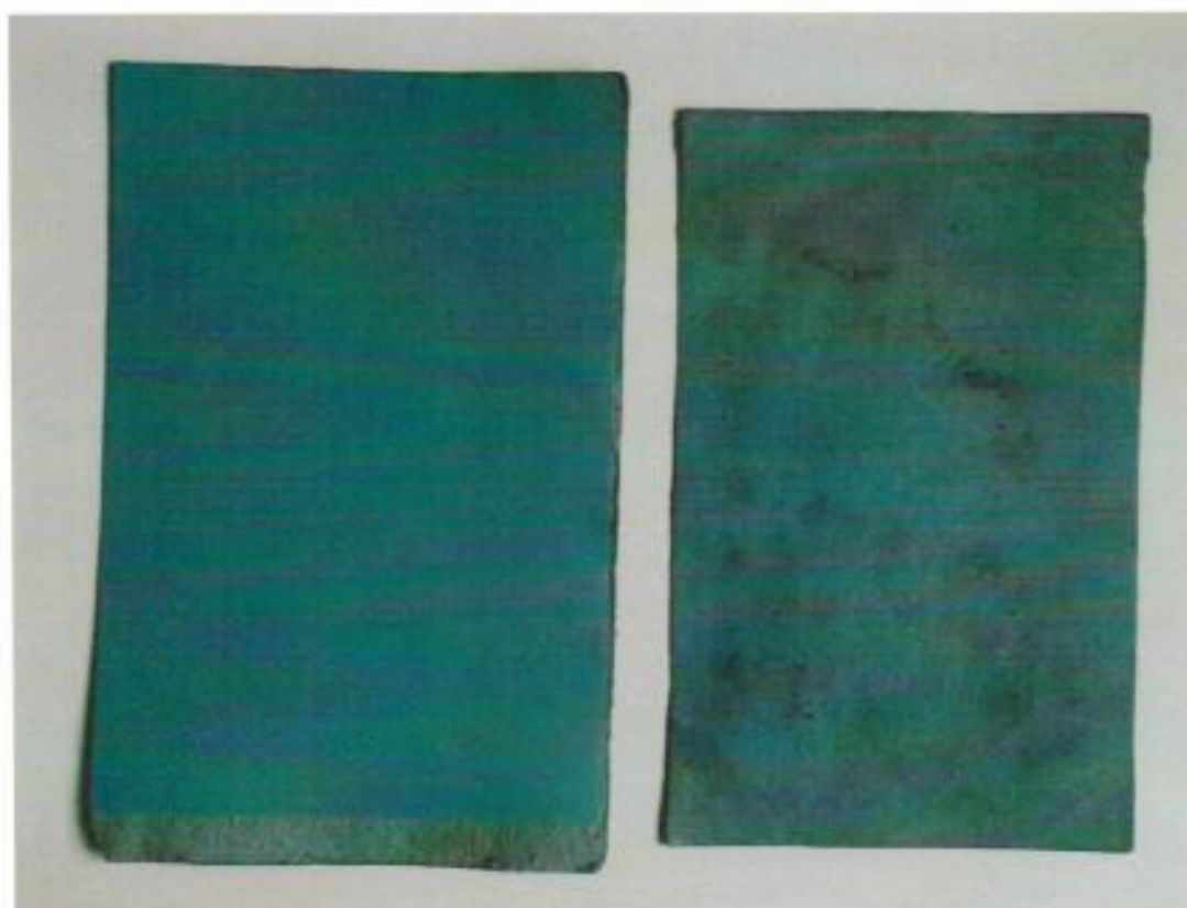
kipótolt és megerősített tábla, illetve az eredeti állapot